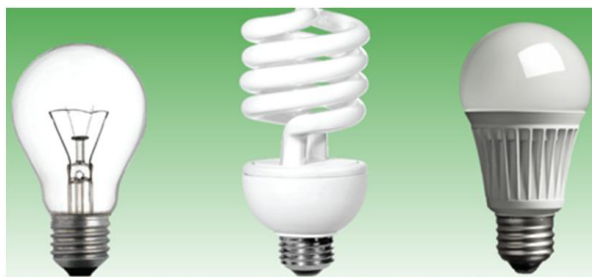
Лампа розжарювання (ЛР) Компактна люмінесцентна лампа (КЛЛ, економка) Світлодіодна лампа (СЛ)

Усе це свідчить про те, що освітлення є найменш електроефективною і досить