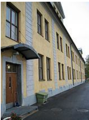
Рис. 9. Казарми для призовників 10-го піхотного полку у Бодені, Швеція

Вивчивши міжнародний досвід проектування й оформлення службових приміщень військової частини, можна зауважити, що у багатьох країнах військовослужбовці сержантського і рядового складу розміщуються в казармах під час служби або навчання (рис. 9 і 10).