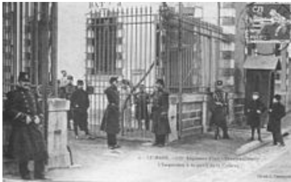
Рис. 2. Казарми 117-го піхотного полку в Інле-Ман, Франція (1900 р.)