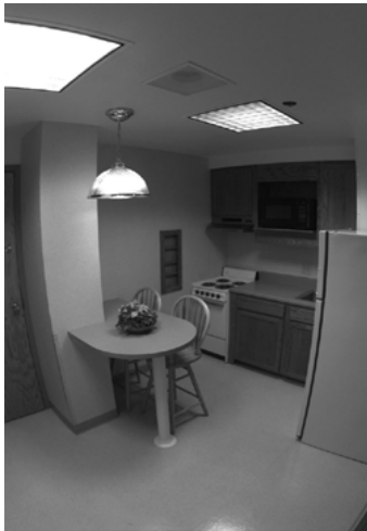
Рис. 12. Кухня за американським проектом “1+1”

Уже на сьогодні США витрачено більше 1 млрд доларів. За американськими підрахунками гуртожитки нового стандарту будуть дорожчими, однак гроші, виділені міністерству оборони, підуть на підтримання бойової готовності та продуктивності сили.