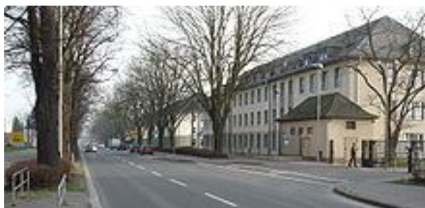
Рис. 10. Німецькі казарми для військ Bundespolizei (федеральної поліції) у Франкфурті, Німеччина

Молоде поповнення, а іноді й молодші сержанти не отримують належних місць, і тому вони можуть бути розміщені у бухтах, у той час як старші сержанти та офіцери проживають як у загальних, так і окремих кімнатах. Термін “гарнізон міста” стосується будь-якого міста, у якому розташовані військові казарми, тобто у місті або поблизу нього розміщені війська.