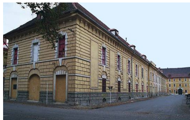
Рис. 7. Дрезден казарми для жінок у фоновому режимі (праворуч)

Будівлю казарм Bodebnach, якщо дивитися на Гассе (північна сторона), зображено на рис. 7.