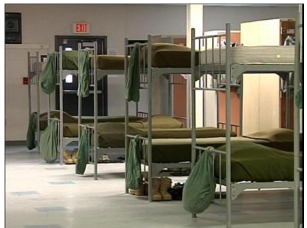
Рис. 11. Казарми у США

Аналіз міжнародного досвіду засвідчив, що військовослужбовці збройних сил США під час базової підготовки, а іноді й подальшого навчання живуть у казармах (рис. 11).