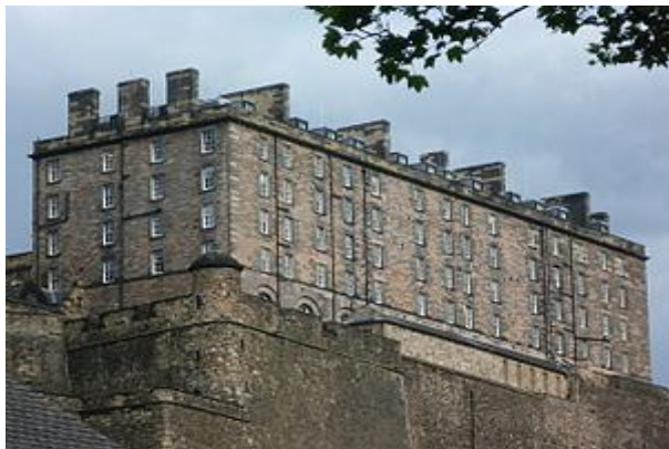
Рис. 3. Казарми за царювання Георга III, Единбурзький замок (кінець XVIII ст.)

Перші казарми, такі, як римської преторіанської гвардії, були побудовані для підтримання елітних сил. Є деякі залишки казарм римської армії у прикордонних фортах, зокрема таких, як Vergovicium та Vindolanda . Завдяки порівнянню залишених історичних та сучасних військових