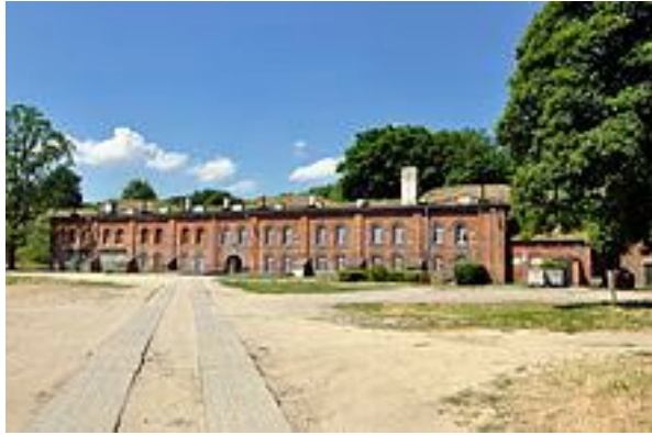
Рис. 1. Казарми у Гданську, Польща

Можуть будуватися у вигляді окремого корпусу, блоку або комплексу (рис. 1 і 2), а також у вигляді архітектурної пам'ятки (казарми Коллінз у Дубліні, Единбурзький замок у Единбурзі – рис. 3) [2–5].