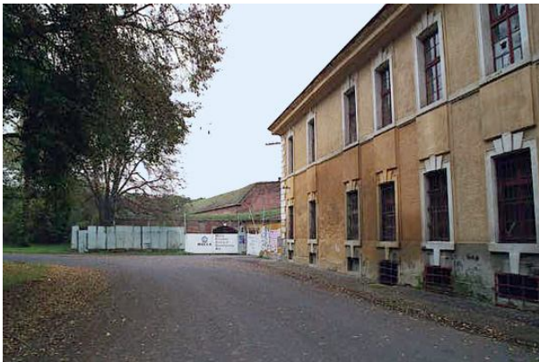
Рис. 5. Bodebnach казарми

На фотографіях (рис. 4 і 5), що зроблені у 2000 р., бачимо казарми, які німці називали казармами Bodebnach (аграрний струмок); на задньому плані північної сторони – бастион. Казарми слугували металевим бар'єром перед бастионом, приховуючи його з чільного боку, і в той же час це була закрита територія для туристів із "шлюзом" усередині стіни бастиону. Будівля мала примітивний вигляд з грубими кам'яними підлогами. Складалася з двох частин, розділених вузьким внутрішнім двором.