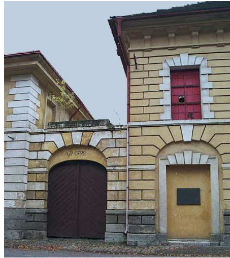
Рис. 6. Казарми Bodebnach (1792 р.)

парку. Ідентичними казармам Bodebnach були казарми Ганновері на протилежному боці міста. Крім того, на цьому ж рисунку зліва можна побачити стіни бастиону, який виглядає з гарнізону на сторону півночі. Прямо навпроти, на південній стороні гарнізону, є ще один ідентичний бастион. Відповідно будівлі казарм розташовувалися між подвійними стінками кожного бастиону. Усередині стін, на південній стороні, розміщувалася перукарня.