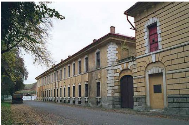
Рис. 4. Казарми у Гетто Терезин

Під час Другої світової війни, коли євреї Великого німецького рейху були відправлені до колишнього військового гарнізону в Терезині, вони розміщувалися в одинадцяти будівлях, колишніх казармах, які використовувалися австрійськими солдатами у XVIII ст.