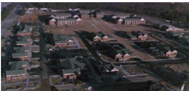
Рис. 13. Казармені комплекси у США

У доповнення до зазначеного вище у США діє ще один проект – “4+1” (рис. 13).