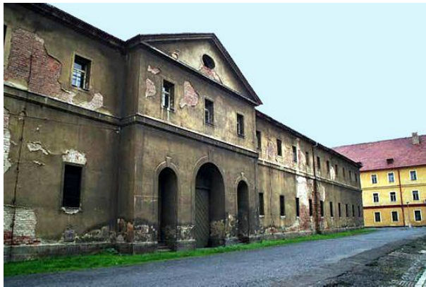
Рис. 8. Ганновер казарми (ліворуч) та казарма Магдебурга (праворуч)

Бачимо вхід до казарми Дрезден для жінок, який виходить на Hauptstrasse (Гауптштрассе). Ганновер казарми подано на рис. 8.