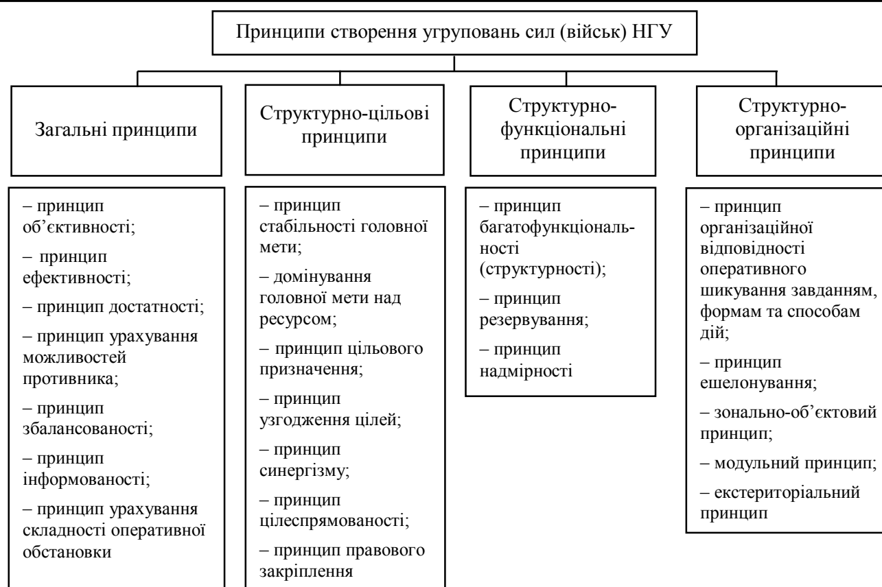
Рис. 1. Класифікація принципів створення угруповань військ (сил) НГУ

Першою групою принципів доцільно визначити загальні принципи створення угруповань НГУ.