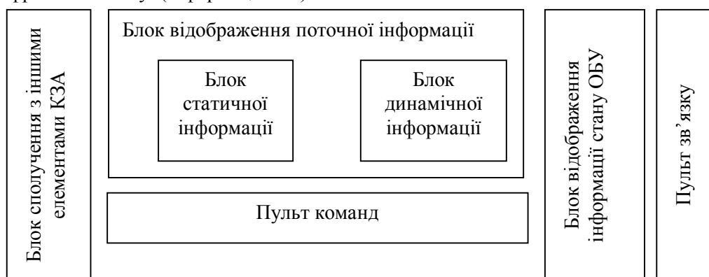
Рис. 4. Склад автоматизованого робочого місця посадової особи штабу (варіант)

Блок відображення інформації стану об'єктів управління побудований за принципом n+1 підблоків, які дозволяють фіксувати поточну інформацію від усіх ОБУ,