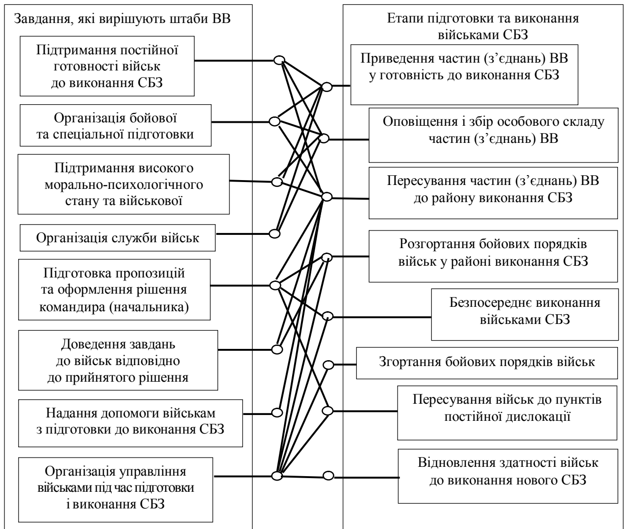
Рис. 1. Взаємний зв'язок завдань, які вирішують штаби, з етапами підготовки та виконання військами СБЗ

Відповідно до [5; 6] важливими завданнями, які вирішують штаби ВВ, можна вважати такі: 1) підтримання у постійній готовності військ до виконання службово-бойових завдань (СБЗ); 2) організація бойової та спеціальної підготовки; 3) підтримання високого морально-психологічного стану та військової дисципліни; 4) організація служби військ як повсякденна військова служба. Виконання штабами зазначених завдань впливає на результати підготовки та виконання військами СБЗ на всіх їх етапах (рис. 1).