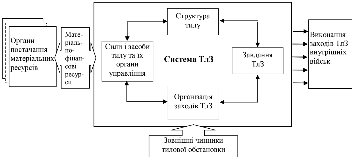
Рис. 1. Принципова схема функціонування системи тилового забезпечення внутрішніх військ

та організацію виконання заходів ТлЗ у звичайних умовах, а також в умовах, що пов'язуватимуться з надзвичайними подіями різного походження.