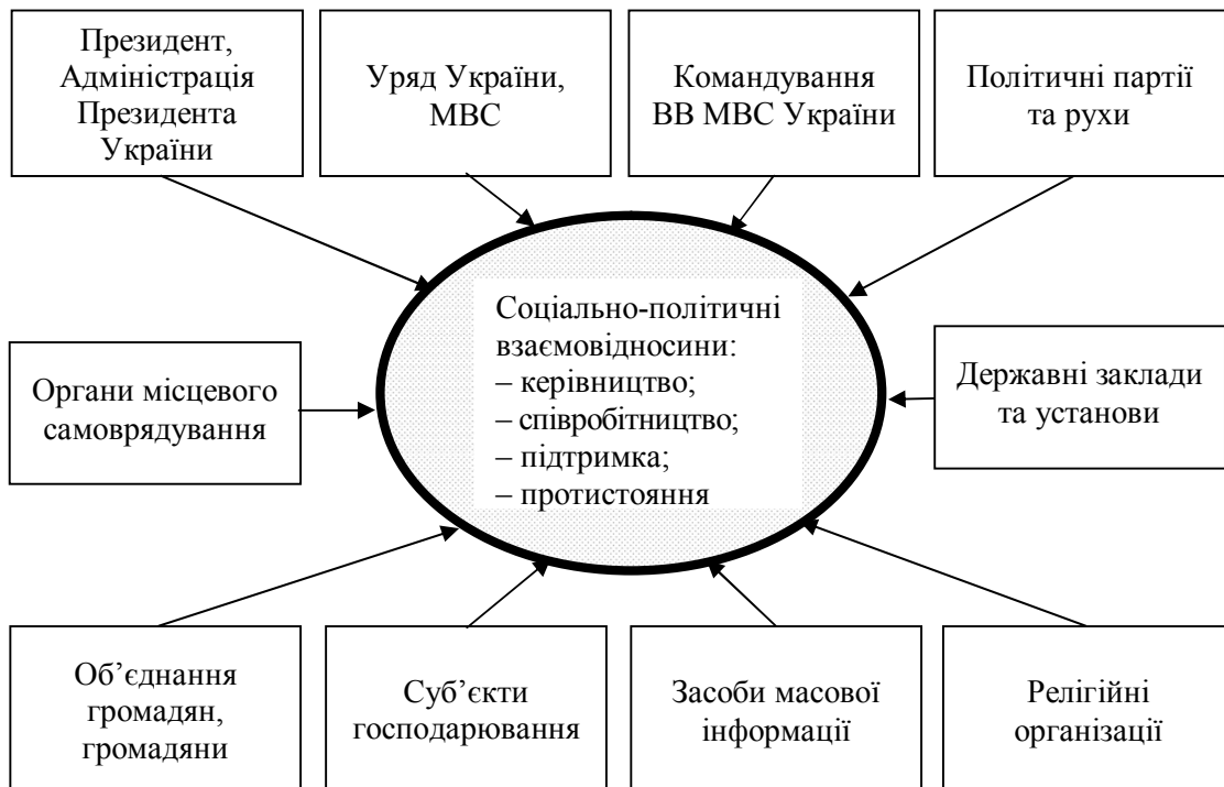
Рис. 1. Суб'єкти соціально-політичних відносин і взаємозв'язки між ними

Аналітична діяльність щодо вивчення стану соціально-політичних відносин і тенденцій їх розвитку складається з аналізу, оцінювання і