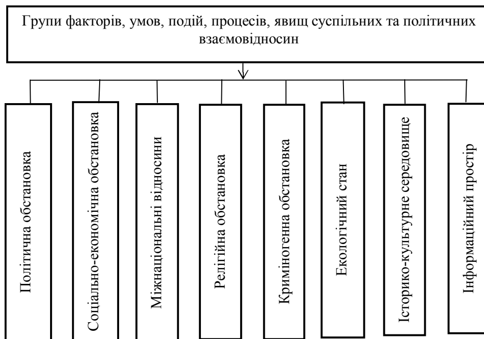
Рис. 1. Групи факторів, умов, подій, процесів, явищ суспільних та політичних взаємовідносин

депутатів; позицією та діями масових громадських організацій, особливо студентських, профспілкових, ветеранських, національних, культурно-освітніх, екологічних та ін.; чисельністю населення, яке підтримує діяльність різних політичних партій і громадських рухів; соціальною базою політичних партій, громадських рухів, їх впливом на настрої, громадську думку населення, на якість виконання завдань, що покладені на внутрішні війська; ставленням партій, рухів, населення до політики Президента, уряду, державних органів; тенденціями змін впливовості політичних партій і рухів, можливістю прогнозування їх діяльності з початком виконання службово-бойових завдань; рівнем напруженості між різними соціальними групами населення у районі виконання службово-бойових завдань (проведення спеціальної операції) та ймовірністю масових заворушень серед місцевого населення; ставленням органів державної влади і місцевого самоврядування, засобів масової інформації, населення до діяльності внутрішніх військ; можливим впливом соціально-політичної обстановки на виконання службово-бойових завдань військовою частиною (з'єднанням).