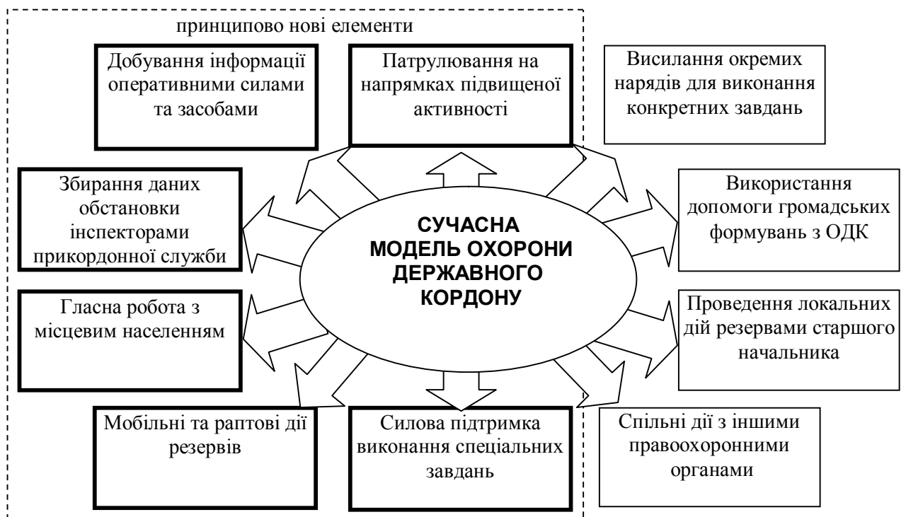
Рис. 2. Базові елементи сучасної моделі охорони кордону