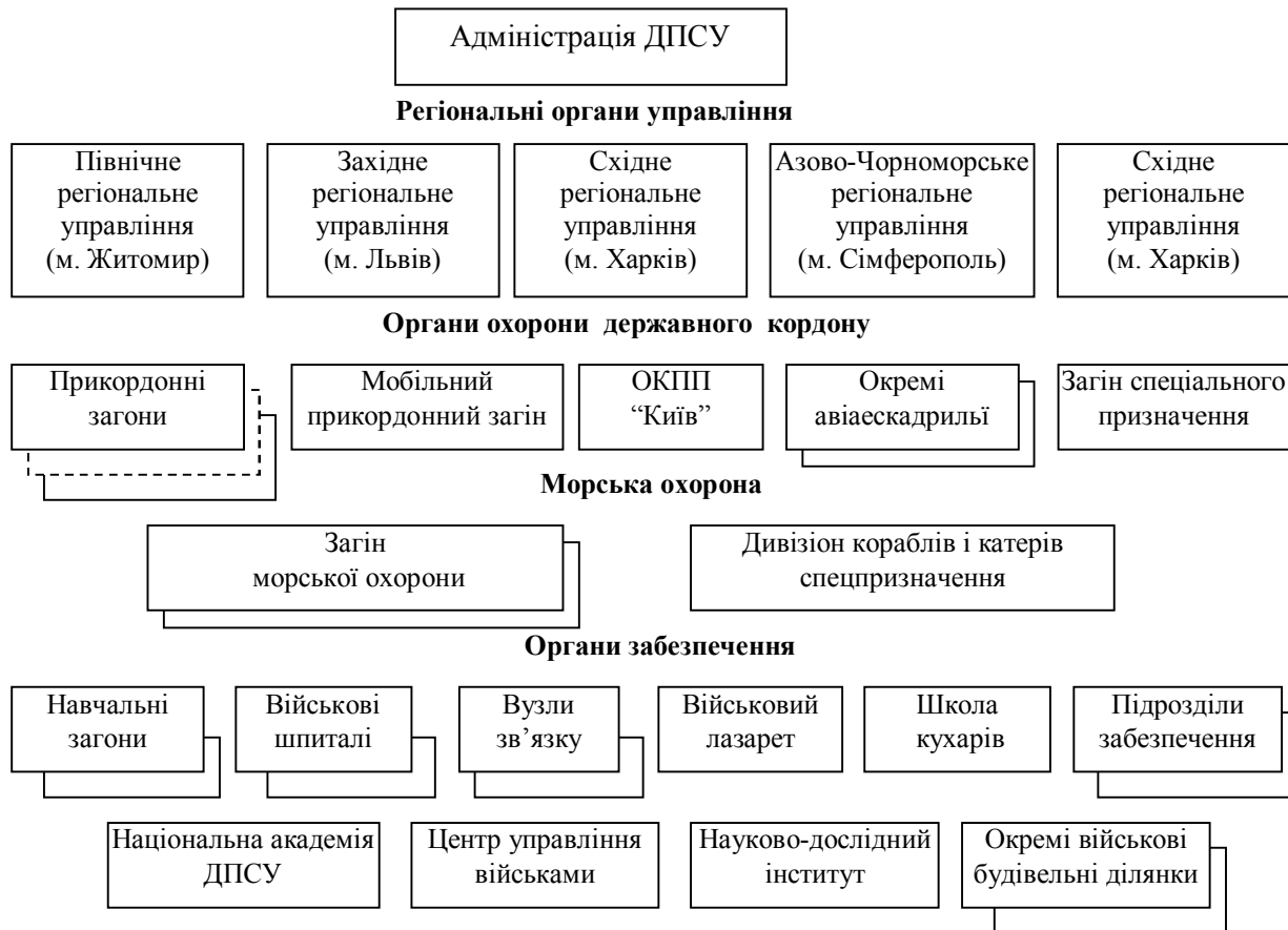
Рис. 3. Загальна структура Державної прикордонної служби України