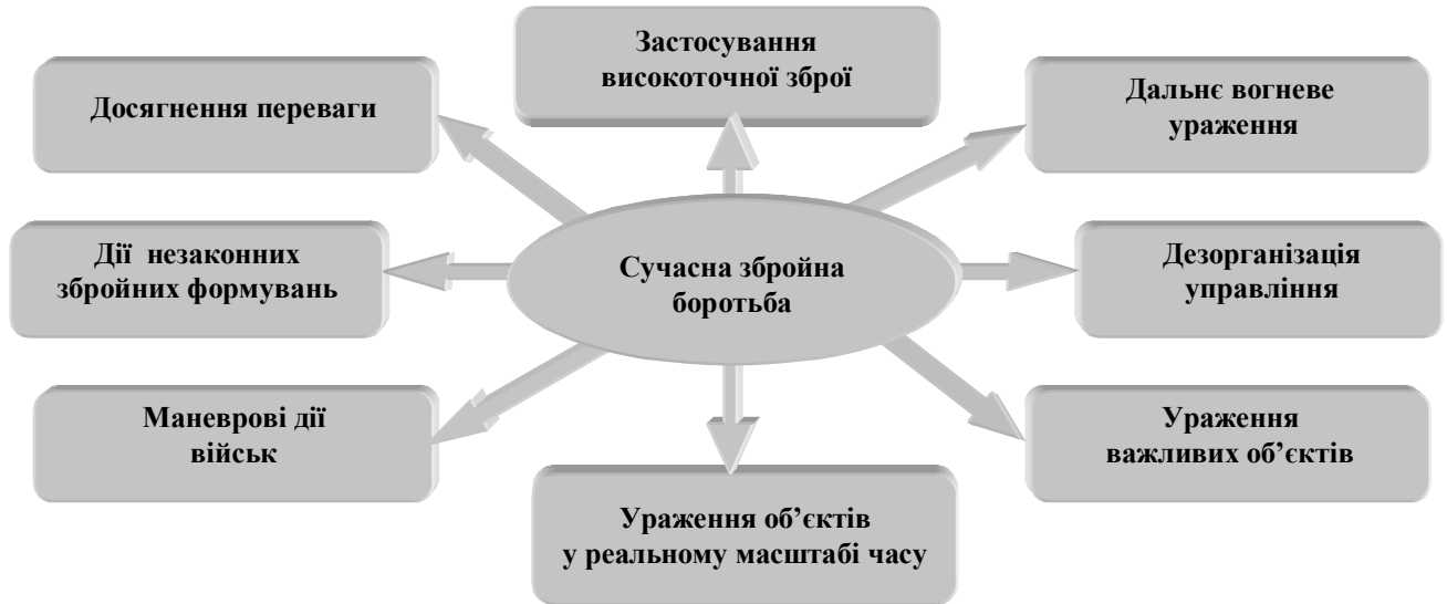
Рис. 1. Характерні риси сучасної збройної боротьби

участі постійно розширюються. Незаконні збройні формування (найманці) – це не передбачені Конституцією держави та її законами об'єднання (групи людей), які володіють бойовою зброєю і бойовими засобами. Вони протиправно створюються з метою силового захисту інтересів