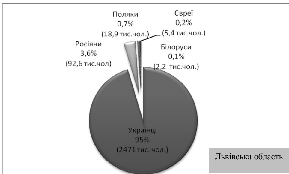
Статистичні дані етнічних груп за регіонами держави станом на 2001 р.

1. Закарпатська область є багатонаціональною. Основним і корінним населенням є українці (80,5 %). Проживають також угорці (12,1 %), румун (2,6 %), росіяни (2,5 %), цигани (1,1 %), словаки (0,5 %), німці (0,3 %), усього понад 30 національностей.