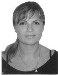
А. В. Харитоновна