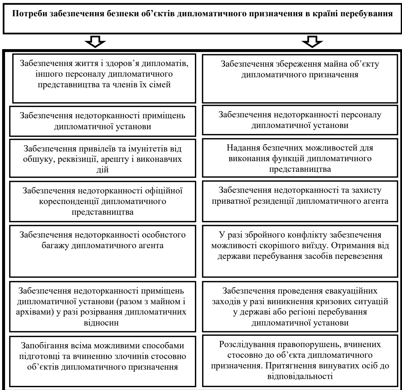
Рис. 2. Потреби забезпечення безпеки об'єктів дипломатичного призначення в країні перебування

Визначення кризової ситуації містяться у низці нормативно-правових актів України. Окремі з них, хоча і втратили чинність, однак будуть нами розглянуті. Основні серед них наведені у таблиці.