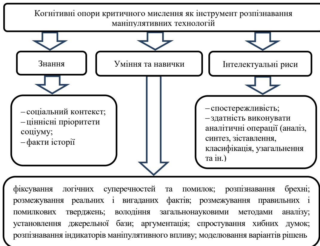
Рисунок 1 – Когнітивні опори критичного мислення як інструмент розпізнавання маніпулятивних технологій

Когнітивні опори розпізнавання маніпуляцій ми поділили на власне текстові та позатекстові. До власне текстових віднесли вміння відшукувати логічні суперечності у текстах повідомлень. До них належить уміння помічати такі помилки.