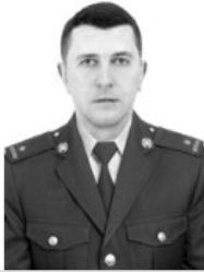
І. В. Євтушенко