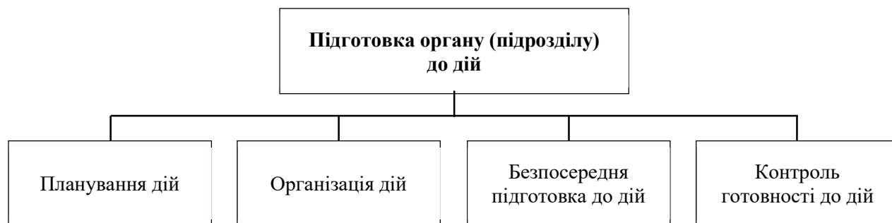
Рисунок 2 – Підготовка органу (підрозділу) до дій

Слід зазначити, що планування – це функція управління, яка охоплює такий комплекс робіт: аналіз ситуацій і впливу чинників зовнішнього і внутрішнього середовища; відпрацювання, оцінювання й оптимізація альтернативних варіантів досягнення цілей, формулювання рішення. Необхідно підкреслити важливу різницю між поняттями «планування» та «розроблення планувальних документів». Перше поняття значно ширше й охоплює друге. Тому планування розпочинається одразу після отримання завдання або виникнення ситуації (проблеми), що спонукає до дій, продовжується оформленням прийнятого рішення, його деталізацією, формуванням завдань виконавцям та розробленням планувальних документів.