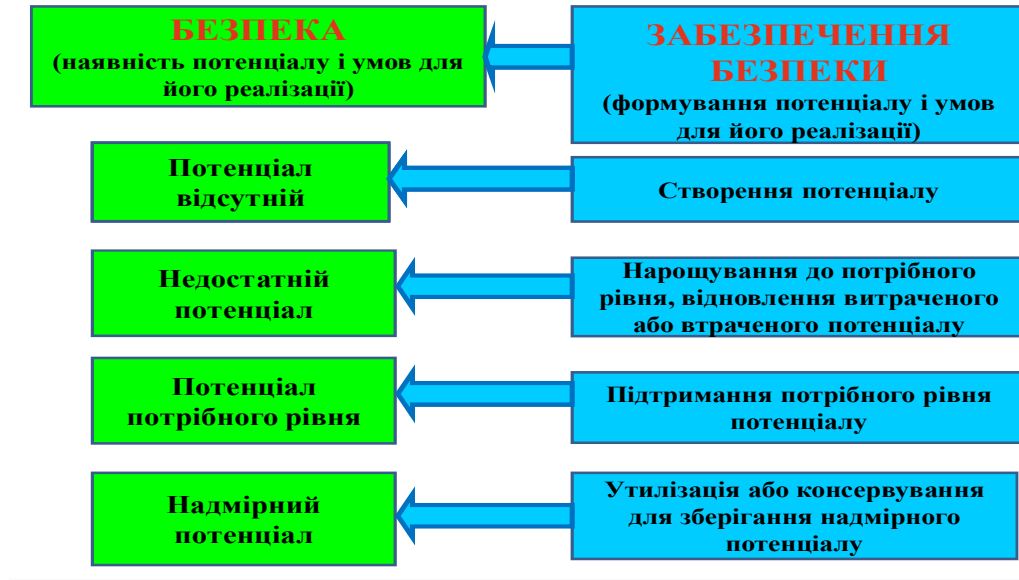
Рисунок 3 – Відповідність між рівнем безпеки та напрямками її забезпечення

Забезпечення безпеки здійснюється шляхом створення, нарощування, підтримання потрібного рівня та відновлення втраченого чи витраченого потенціалу, утилізації чи консервації надмірного потенціалу, що є функціями відповідної системи забезпечення безпеки.