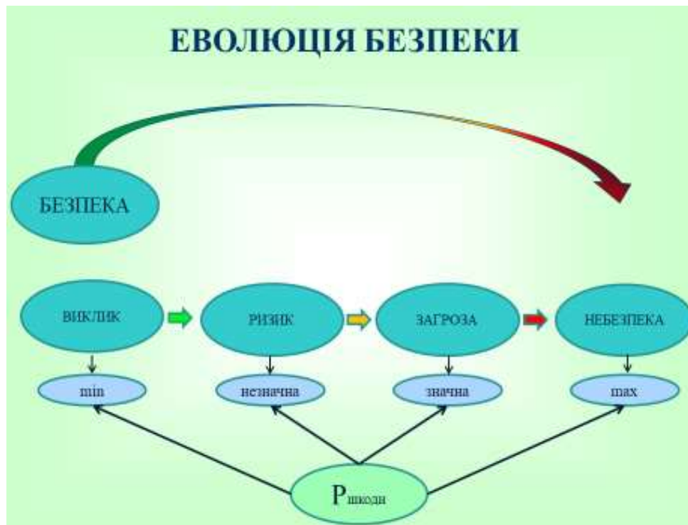
Рисунок 2 – Схематичне зображення процесу еволюції від безпеки до небезпеки

Рівень загроз має еволюцію (рис. 2) від викликів до небезпек і характеризується імовірністю нанесення шкоди від мінімальної до максимальної.